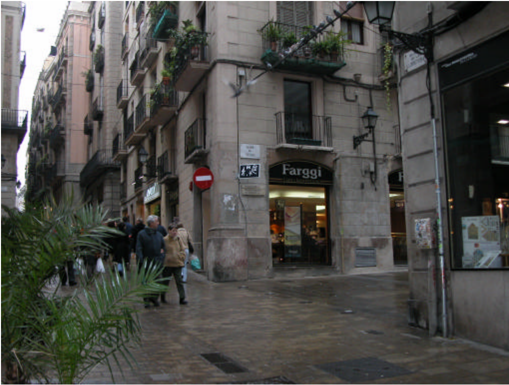
Fotografia 1. Vista general de la cruïlla entre els carrers Baixada de la Llibreteria i Veguer

Gestió i Difusió del Patrimoni Arqueològic i Històric