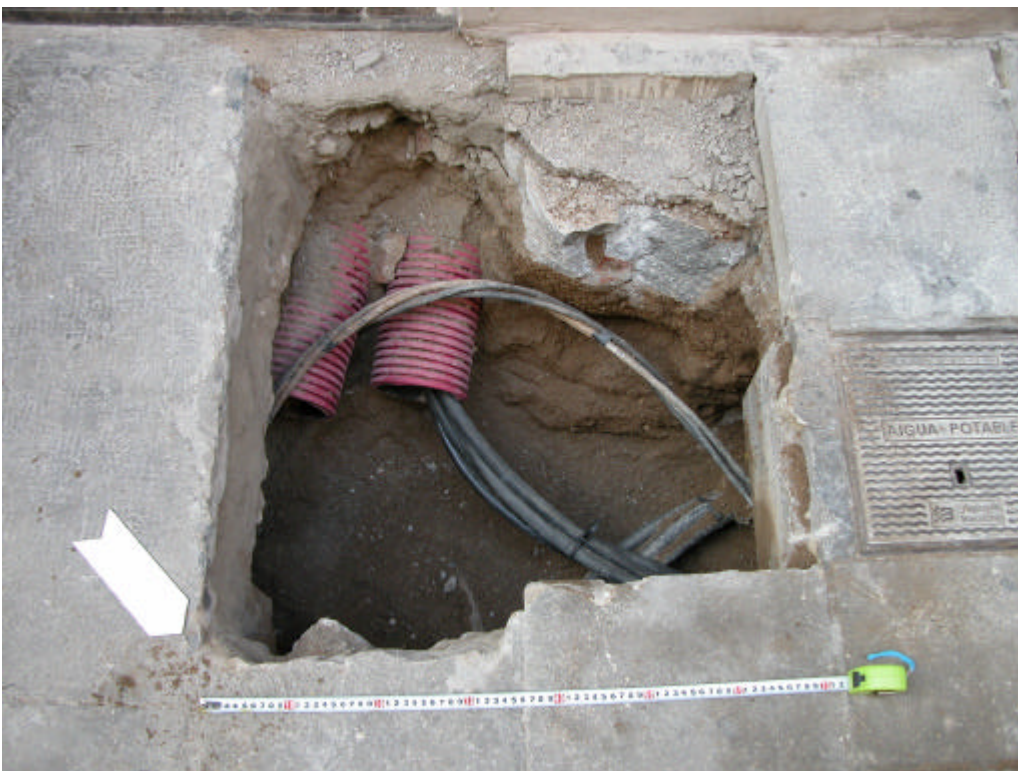
Fotografia 8. Rasa 500