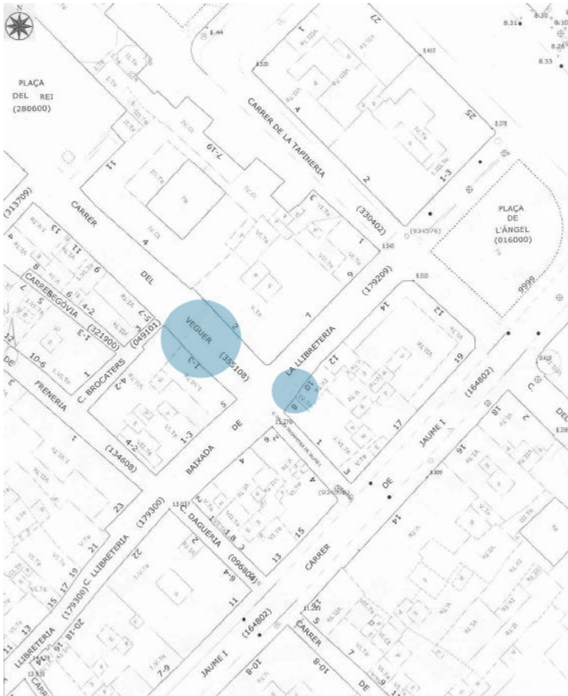
Plànol 1. Plànol general de la zona afectada Escala 1:500

Gestió i Difusió del Patrimoni Arqueològic i Històric