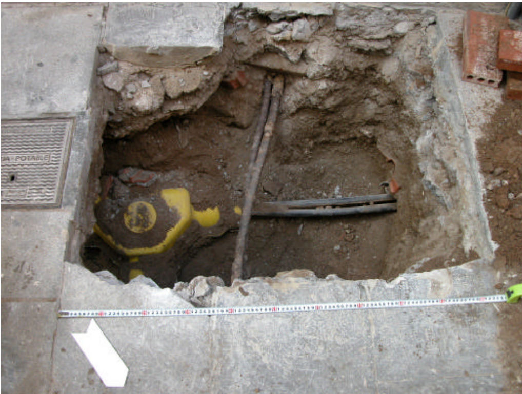
Fotografia 7. Rasa 400

Gestió i Difusió del Patrimoni Arqueològic i Històric