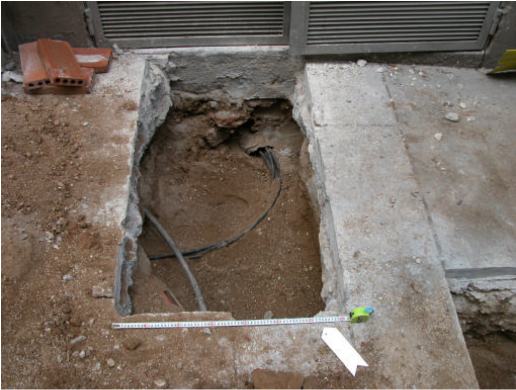
Fotografia 5. Rasa 200

Gestió i Difusió del Patrimoni Arqueològic i Històric