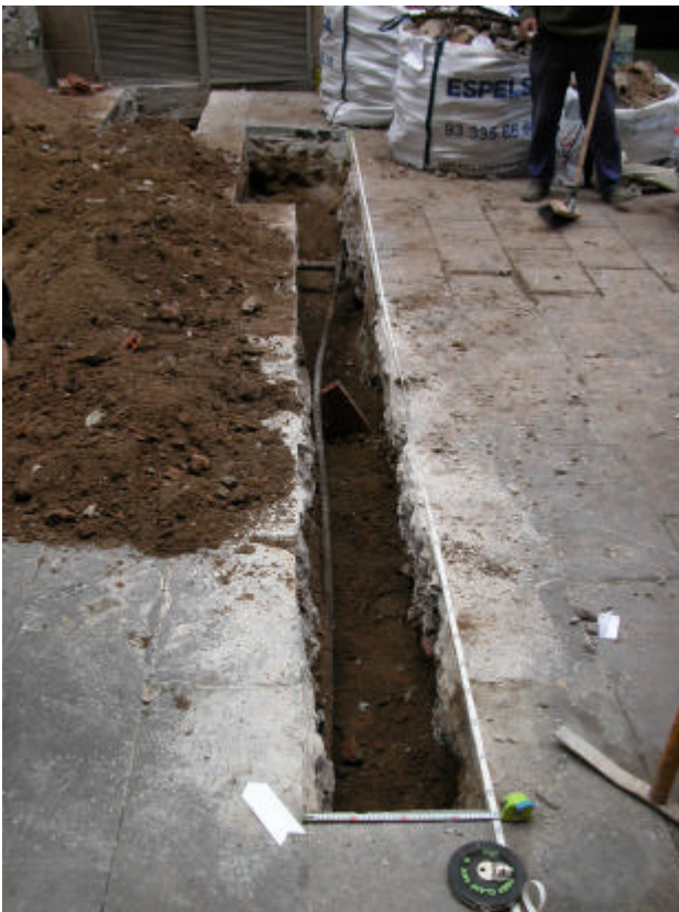
Fotografia 6. Rasa 300