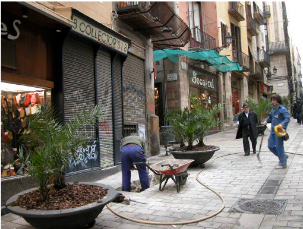
Fotografia 2. Treballs d'obertura de la Rasa 100 (situació en què es trobava la rasa quan es va iniciar el control arqueològic dels treballs).