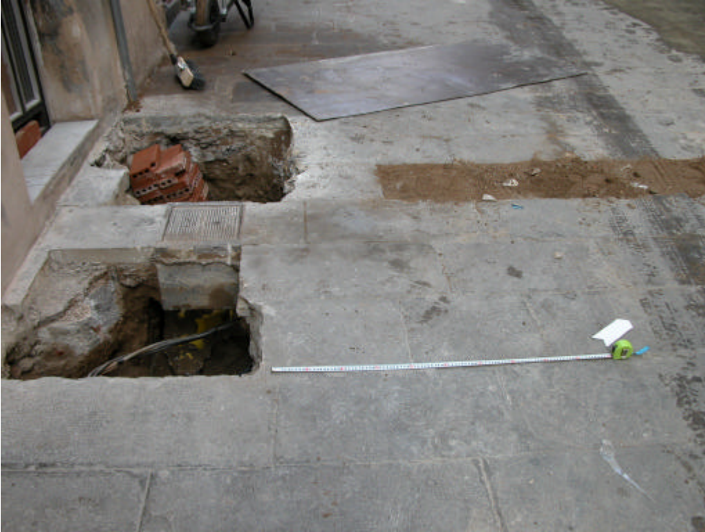
Fotografia 9. Situació de la Rasa 300 en relació a la 400 i 500

Gestió i Difusió del Patrimoni Arqueològic i Històric