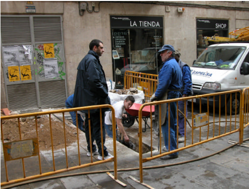
Fotografia 3. Treballs d'obertura de la Rasa 300 (situació en què es trobava la rasa quan es va iniciar el control arqueològic dels treballs)

Gestió i Difusió del Patrimoni Arqueològic i Històric