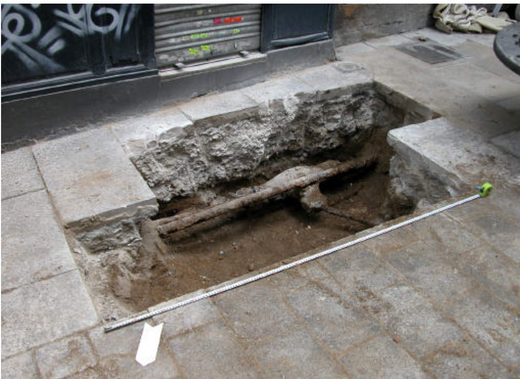
Fotografia 4. Rasa 100